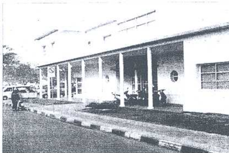
FONDOS. La UGD todavía está pagando los gastos de la licitación 1008, pero tiene presupuesto para continuar haciendo obras.

"Este fue un compromiso que se había asumido con los comerciantes de la zona que ahora estamos cumpliendo aplicando un descuento importante que pone en pie de igualdad a Maldonado con el resto del país", señaló.