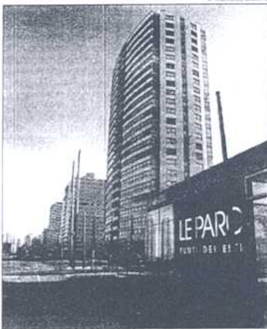
Las obras comenzarán por los edificios del fraccionamiento 'Lobos', que totalizan 500 apartamentos.

El proyecto implicará la construcción de una nueva planta de tratamiento de líquidos residuales en la zona de Rincón del Indio, que estará ubicada sobre la avenida Aparicio Saravia entre la calle San Pablo y el arroyo Mal-